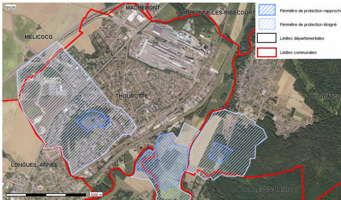
Carte publiée par l'application CARTELIE © Ministère de la Transition Écologique et Solidaire CP21 (DOM/ETER)